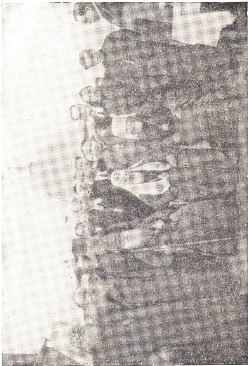
ГРУППА ДЕЛЕГАТОВ КОНФЕРЕНЦИИ